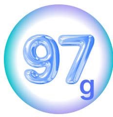
本体重量（電池除く）

そんなお悩みを、小さな「ハンディリモコン」が解決します。ペアリングをするだけで、お手元に届いたその日から、快適な環境をサポートします。