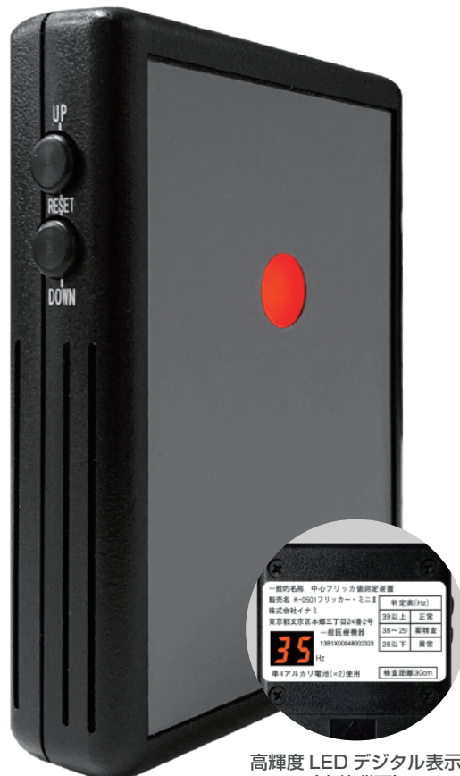
高輝度 LED デジタル表示 (本体背面)